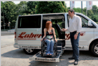
Kassettenlift und Hebebühnen

„Tätigkeitsschwerpunkte unserer Werkstatt sind die Herstellung und der Einbau von Hilfsmitteln, sowie die Adaption von Fahrzeugen für mobilitätseingeschränkte Personen.