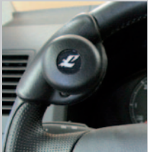
Lenkhilfen , Multifunktionslenkradknöpfe, Lenkkgabel oder Dreizack