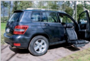
Einstieghilfen , Schwenksitze und Rutschbretter