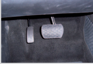
Linksgas mechanisch oder elektronisch umschaltbar