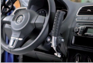
Handbediengeräte zur beinlosen Bedienung von Bremse und Gas